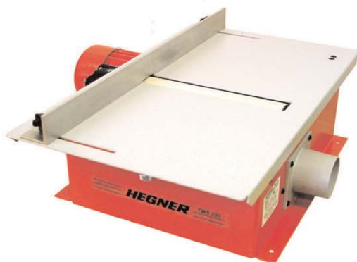
Table de ponçage TWS 230